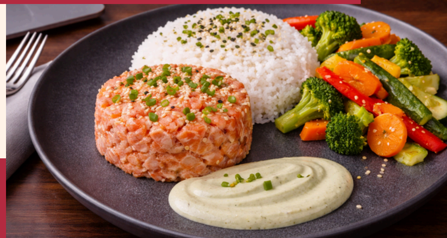
OCÉAN PRINTANIER 28,90 € HT