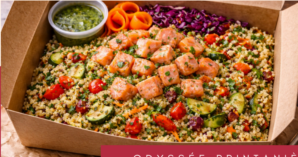
ODYSSÉE PRINTANIÈRE 16,50 € HT