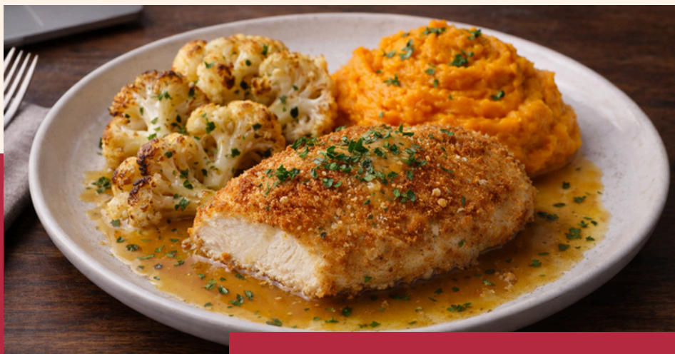
GOURMANDISE PRINTANIÈRE 28,50 € HT