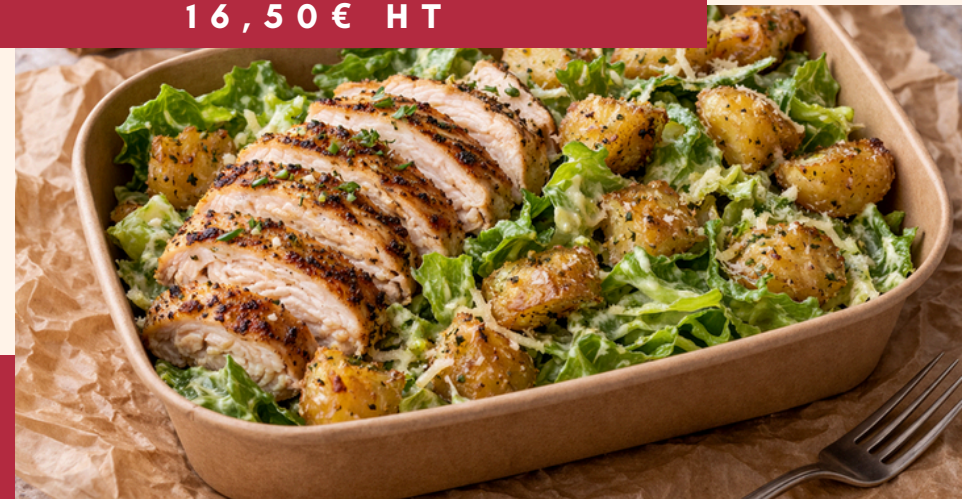
ÉPOPÉE PRINTANIÈRE 16,50 € HT